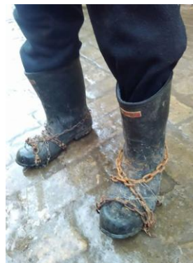
Hólánccal egy lépést se, mert az EU több országában kötelező a hólánccal való járás