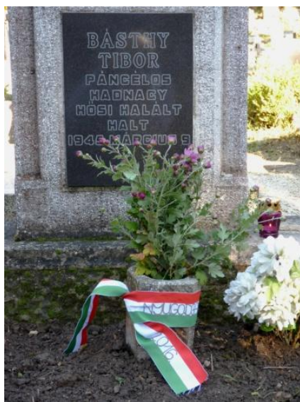
Egy a hadisírok közül