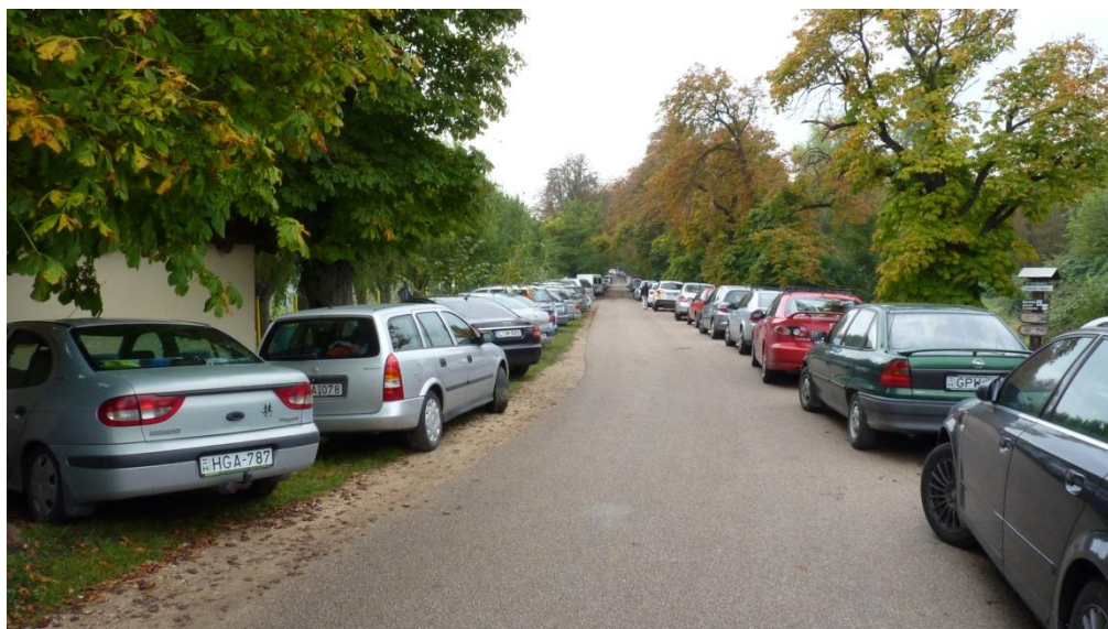
Az alkalmi parkolóba nem fért autók egy része

minkét oldalán. A két nap alatt sokan megfordultak nálunk. Voltak közöttük, akik most jöttek el hozzánk először. Voltak közöttük olyanok is, akik már jártak itt valamikor és tapasztalhatták, hogy az utóbbi években mennyit fejlődött és szépült helységünk. Reméljük, pozitív véleményekkel távoztak tőlünk.