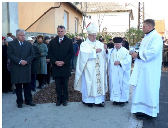
Az utcaszakasz megszentelése

A szentmise után megyéspüspökünk megszentelte a Kossuth utca templom előtti (Petőfi és B. Zsilinsky utcák közötti) felújított, aszfaltos és térköves szakaszát.