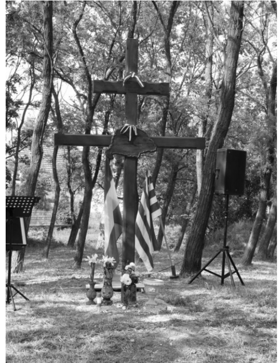
Kettős kereszt a Tófenéknél